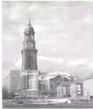
die Michaeliskirche (der Kirchturm - 132 m hoch, man - Treppen steigen/Fahstuhl fahren, der Aussichtspunkt)