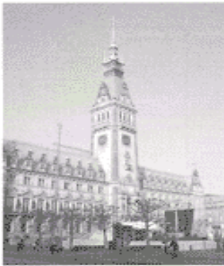
das Rathaus (der Bürgermeister - arbeiten)