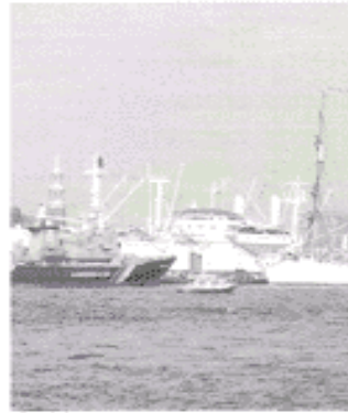
der Hafen (viele Schiffe - Waren bringen und abholen)